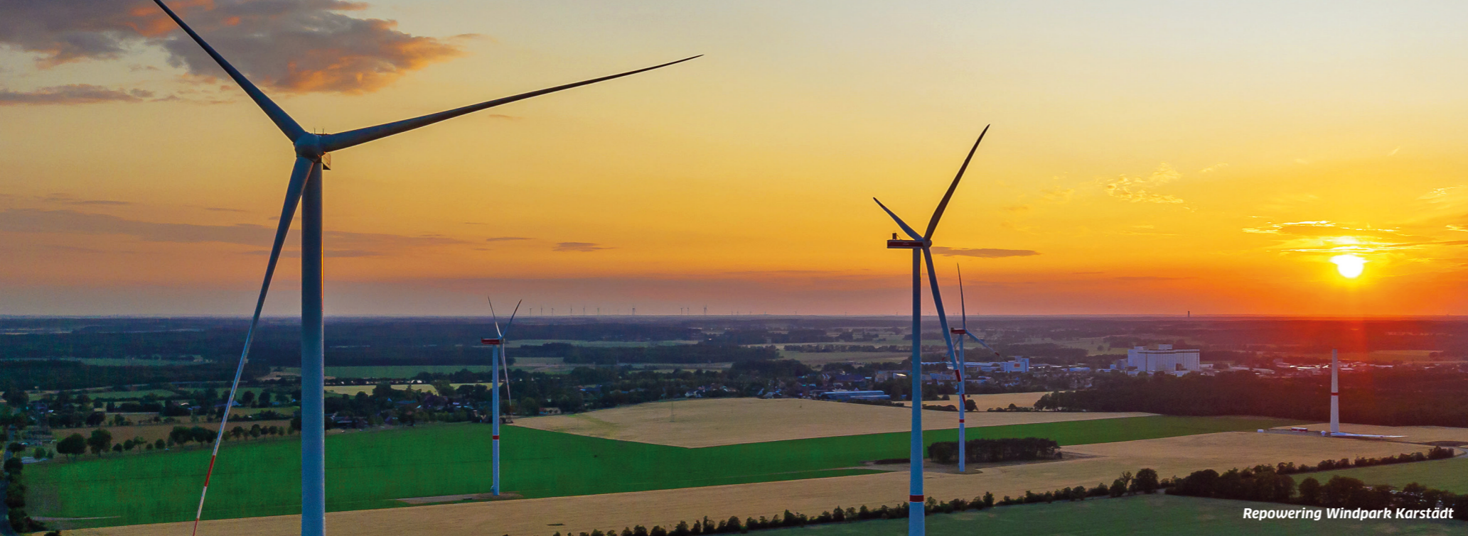
Repowering Windpark Karstädt

EINES DER FÜHRENDEN UNTERNEHMEN WELTWEIT BEI ERNEUERBAREN ENERGIEN.