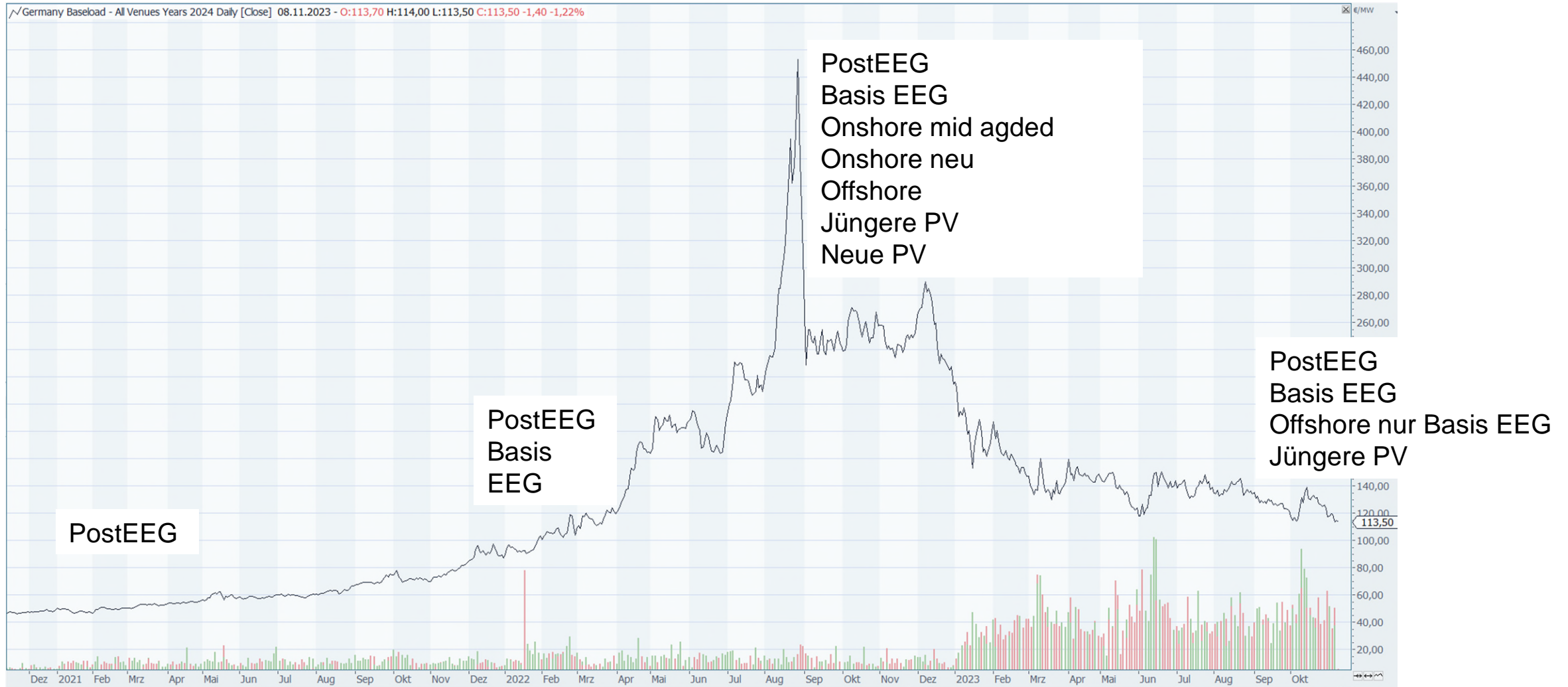
Screenshot Trayport Joule